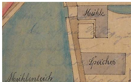
Plan der Zainhammer Mühle aus dem Jahr 1894

Weit vor der Stadt, im sumpfigen Schwärzetal, unter schattigen Kastanien,