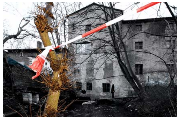
Gesperrte Zainhammer Mühle 2008, Foto Torsten Stapel

Der laufende Betrieb soll sich dabei aus Mitgliedsbeiträgen des Vereins und weiterer Nutzer, Eintrittsgeldern, z. B. aus Veranstaltungen gemeinsam mit dem Wald-Solar-Heim, dem Forstbotanischen Garten und dem Zoo, Pacht aus einem kleinen Café „KaffeMühle“ im Garten neben der neuen Fischtreppe, Mieten von Gastkünstlern, Einspeisung der Energie aus der Wasserkraft, Fördermitteln, Honoraren aus Auftragswerken für die Mühlenkünstler u. v. a. m. tragen. Bitte helfen Sie mit Ihrer Spende dem Kunstverein, und geben Sie der Zainhammer Mühle ein weitere Chance!